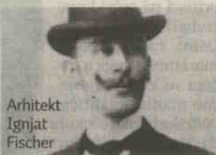
Arhitekt Ignjat Fischer