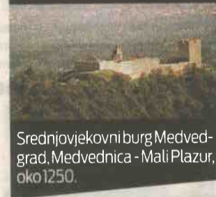
Srednjovjekovni burg Medvedgrad, Medvednica - Mali Plazur, oko 1250.

denta koji je dobio najviše nagrada, pohvala i priznanja s prosjekom ocjena oko 4,95, što je ujedno najviše u povijesti našeg fakulteta - kaže profesor Zlatko Karač, znanstveni savjetnik i docent na Katedri za urbanizam te voditelj nakladništva Arhitektonskog fakulteta u Zagrebu.