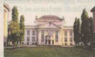
Secesijska palača stare Nacionalne i sveučilišne knjižnice, Marulićev trg 21, Rudolf Lubynski, 1913. (danas Hrvatski državni arhiv)