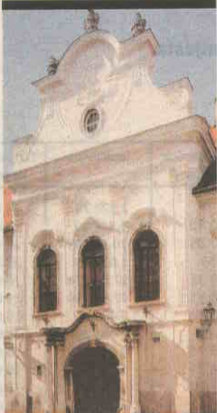
Kasnobarokna palača Vojković-Oršić-Rauch, Matoševa 9, 1764. (danas Hrvatski povijesni muzej)