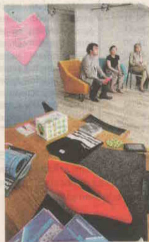
Izložba se može pogledati u galeriji Forum u Zagrebu od 27. lipnja do 6. srpnja

moći će vidjeti i kako je nastao prvi dizajnerski hostel na ovim prostorima, splitski Goli&Bosi, arhitektonskog studija UP i dizajnera Damira Gamulina, a bit će tu i hvaljena Kvadra Design s nagrađenom sofom Revolve i naslonjačem i dvosjednom 3angle, za koje su zaslužni dizajneri iz Numen/ForUse i Grupe.