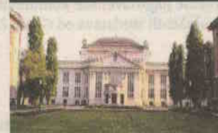
Secesijska palača stare Nacionalne i sveučilišne knjižnice, Marulićev trg 21, Rudolf Lubynski, 1913. (danas Hrvatski državni arhiv)