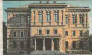
Historiciistička palača HAZU, Trg Nikole Šubića Zrinskog 11, Friedrich von Schmidt, 1880.