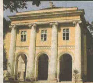
Barokno-klasicistička palača Magdalenić-Drašković-Jelačić, Demetrova 7, klasicističko preoblikovanje atribuirano Bartolu Felbingeru, oko 1830.