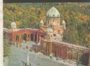
Historičističke arkade groblja Mirogoj, Herman Bollé, 1879. (dograđivane do 1933.)