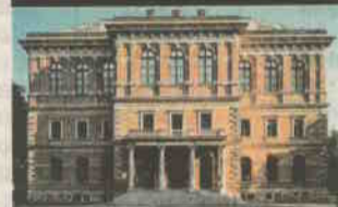
Historicistička palača HAZU, Trg Nikole Šubića Zrinskog 11, Friedrich von Schmidt, 1880.