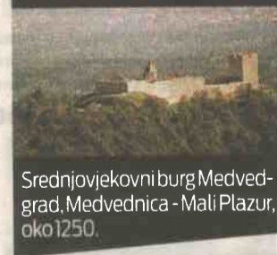
Srednjovjekovni burg Medvedgrad, Medvednica - Mali Plazur, oko 1250.

denta koji je dobio najviše nagrada, pohvala i priznanja s prosjekom ocjena oko 4,95, što je ujedno najviše u povijesti našeg fakulteta - kaže profesor Zlatko Karač, znanstveni savjetnik i docent na Katedri za urbanizam te voditelj nakladništva Arhitektonskog fakulteta u Zagrebu.