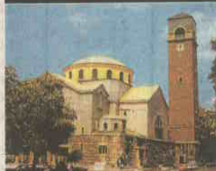
Protomoderna crkva Sv. Blaža, Prilaz Đure Deželića 64 / Primorska, Viktor Kovačić, 1913.