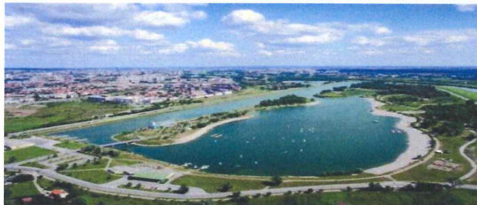
SPORTSKO REKREACIJSKI CENTAR JARUN

Provedene su izmjene i dopune Odluke i Elaborata Plana po osnovi usklađenosti Plana sa Zakonom o prostornom uređenju (NN 153/13).