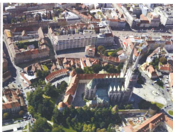
pogled na središnji dio grada Zagreba

Generalnim urbanističkim planom grada Zagreba regulira se prostorni razvoj grada Zagreba u skladu sa strateškim opredjeljenjima utvrđenima Razvojnoum strategijom Grada Zagreba, uz određivanje prostorno-planskih preduvjeta za realizaciju strateških i drugih investicija i projekata. Važećim Generalnim urbanističkim planom grada Zagreba (Službeni glasnik Grada Zagreba 16/07, 8/09, 7/13 i 9/16) utvrđena je temeljna organizacija prostora, zaštita prirodnih, kulturnih i povijesnih vrijednosti, korištenje i namjena površina s prijedlogom uvjeta i mjera njihova uređenja.