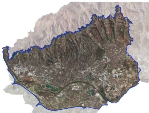
područje obuhvata Generalnog urbanističkog plana grada

Obuhvat Izmjena i dopuna istovjetan je prostoru Generalnoga urbanističkog plana grada Zagreba koji je određen Prostornim planom Grada Zagreba, a obuhvaća uže područje grada Zagreba, između Parka prirode Medvednica i zagrebačke obilaznice, površine oko 220 km 2 .