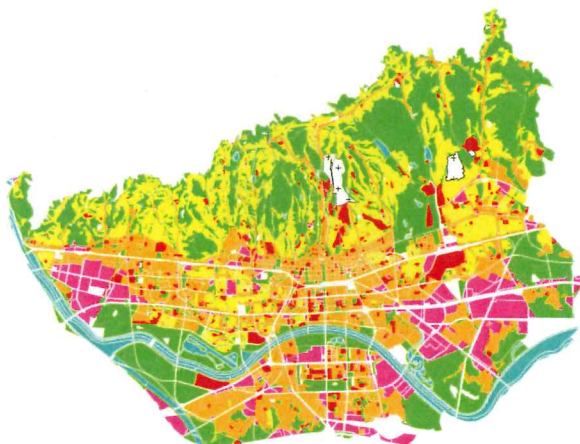
Korištenje i namjena prostora

Generalnim urbanističkim planom grada Zagreba regulira se prostorni razvoj grada Zagreba u skladu sa strateškim opredjeljenjima utvrđenima Razvojnoum strategijom Grada Zagreba, uz određivanje prostorno-planskih preduvjeta za realizaciju strateških i drugih investicija i projekata. Važećim Generalnim urbanističkim planom grada Zagreba (Službeni glasnik Grada Zagreba 16/07, 8/09, 7/13 i 9/16) utvrđena je temeljna organizacija prostora, zaštita prirodnih, kulturnih i povijesnih vrijednosti, korištenje i namjena površina s prijedlogom uvjeta i mjera njihova uređenja.