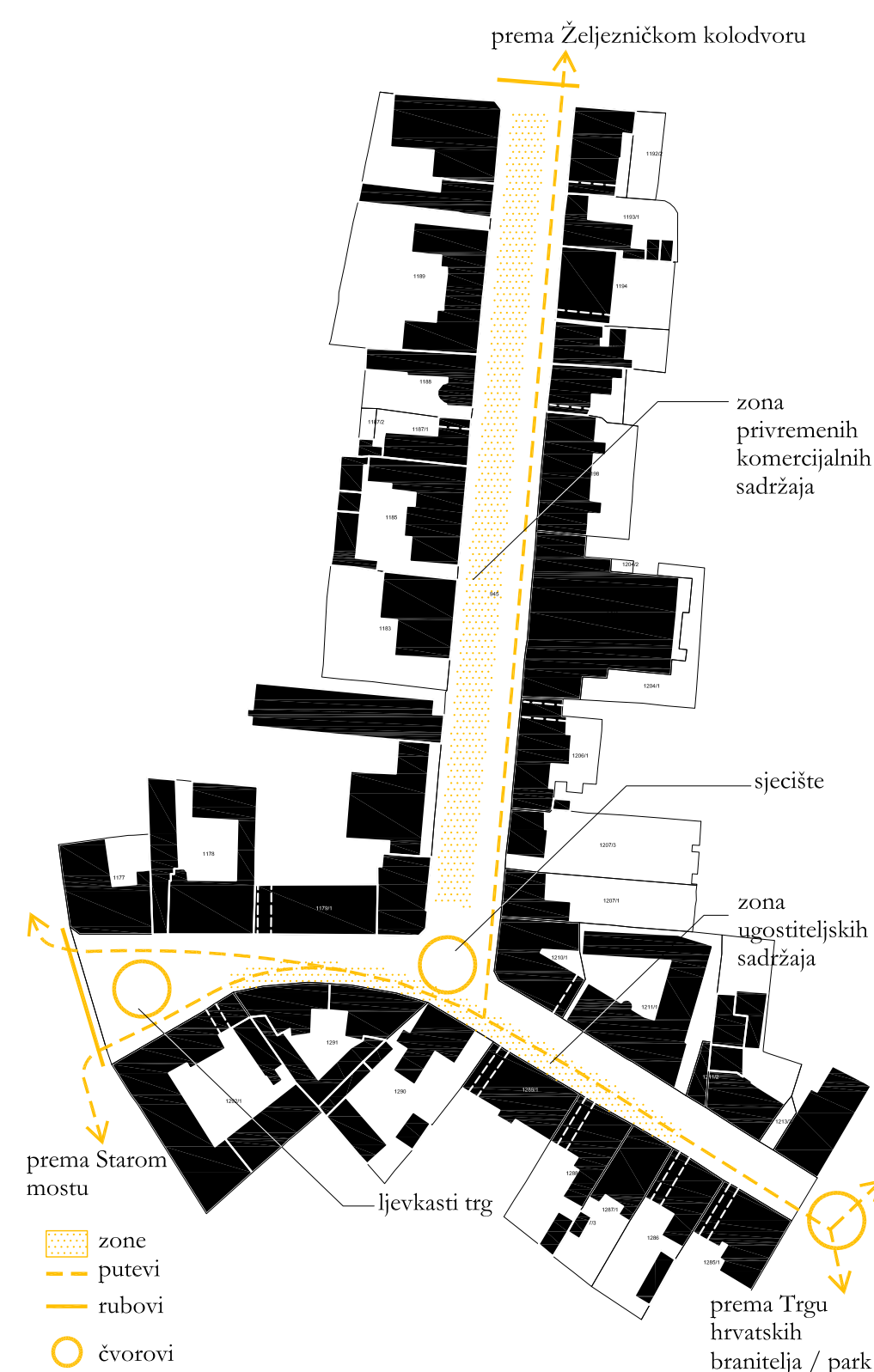
Schema - prostorna analiza L sj

šetnica - prostor za privremenu manifestaciju, sajmove, izložbe, autohtoni proizvodi, kupujemo hrvatsko i sl.